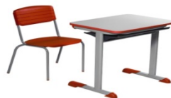
Imagem somente ilustrativa

A COMPROVAÇÃO SERÁ FEITA ATRAVÉS DA INFORMAÇÃO CONSTANTE DO CATÁLOGO EXPEDIDO PELO FABRICANTE OU