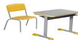
Imagem somente ilustrativa

A COMPROVAÇÃO SERÁ FEITA ATRAVÉS DA INFORMAÇÃO CONSTANTE DO CATÁLOGO EXPEDIDO PELO FABRICANTE OU AINDA ATRAVÉS DE CONSULTA NO SITÍO DO FABRICANTE.