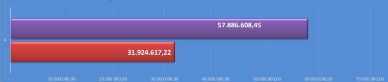
Quociente do Fluxo de Caixa Líquido das Atividades Operacionais em Relação ao Resultado Patrimonial Conforme MCASP